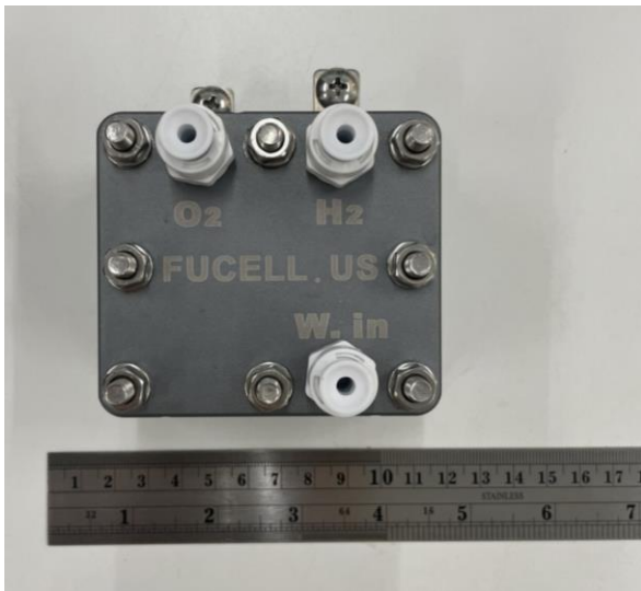
圖一:純水入口、氧氣+純水出口